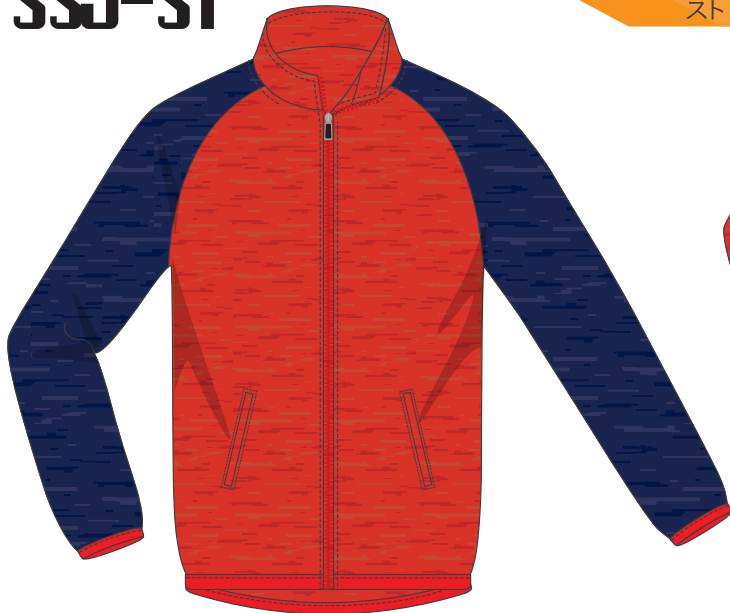
レッド × ネイビー