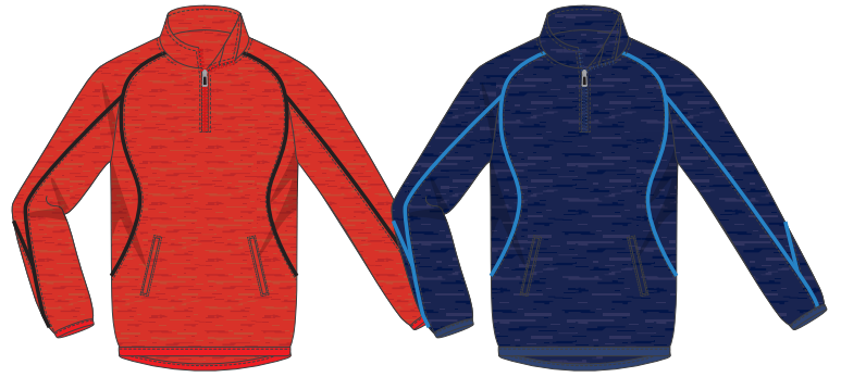
レッド × ブラック ネイビー × マリンブルー

春・秋のアウトターや冬のインナーにもなる 使い勝手のいいスエット生地ジャージです。