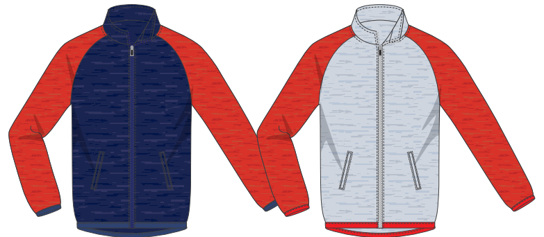
ネイビー × レッド 空グレー × レッド

春・秋のアウトターや冬のインナーにもなる 使い勝手のいいスエット生地ジャージです。