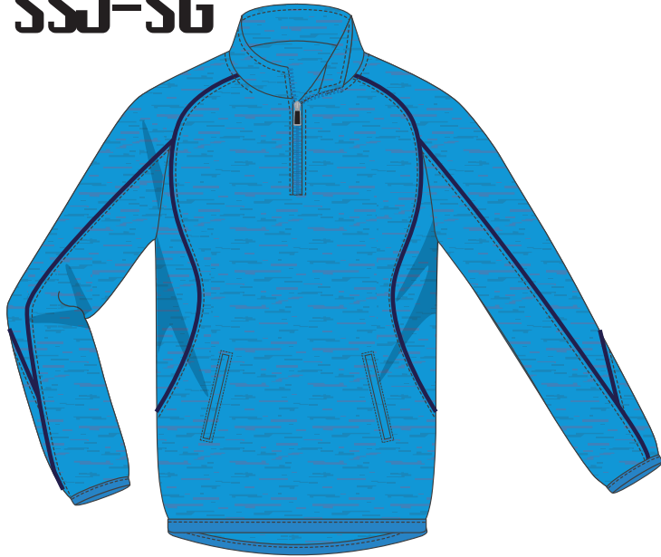
マリンブルー × ネイビー