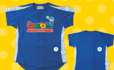
フロントオープンD型