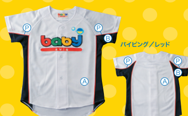
フロントオープンW型/パイピング付き