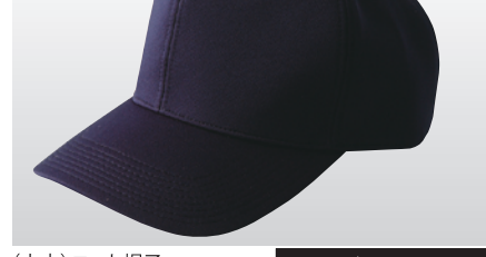
マジックテープ式 品番 CH-67MT ¥1,900 (税抜) サイズ J-F-X 素材/ポリエステル100%