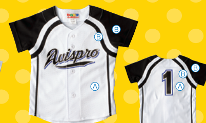
フロントオープン袖切替型