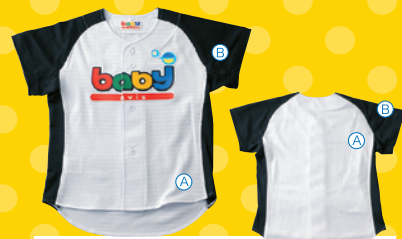
フロントオープンG型