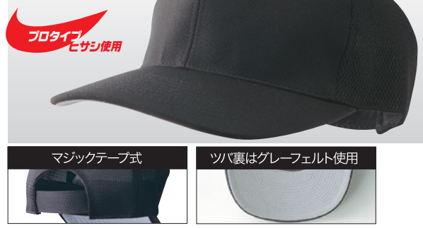
マジックテープ式 ツバ裏はグレーフェルト使用