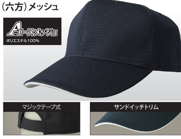
マジックテープ式 サンドイッチトリム