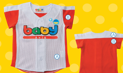
フロントオープンシャツL型