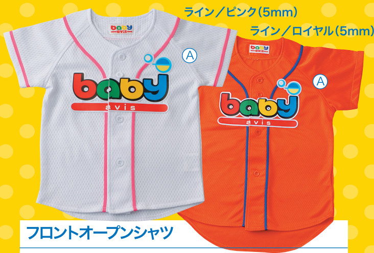
フロントオープンシャツ